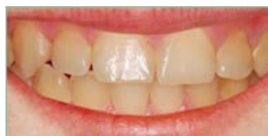
Chrup po ošetření pomocí DMG Icon