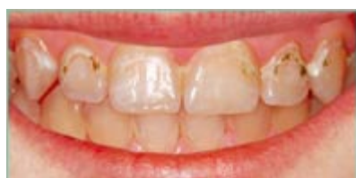
Chrup před ošetřením